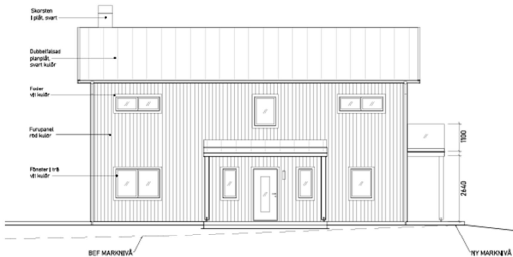
FASAD MOT NORR 1:100

VITSIPPAN 1:1 BYGGLÖV NYBYGGNAD ENBOSTADSHUS FASADER