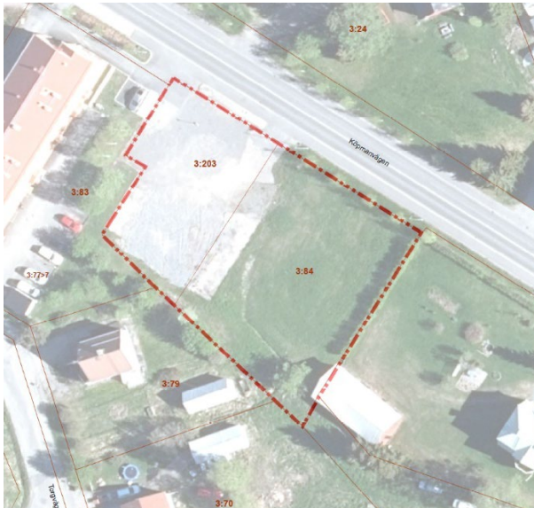
Området är rödmarkerat.

Stiftelsen KALIXBO ansöker om att upprätta en ny detaljplan för fastigheterna Töre 3:84 och Töre 3:203, som ägs av stiftelsen. Syftet är kunna uppföra flerfamiljshus inom området. Gällande detaljplan medger inte detta eftersom markanvändningen i denna är avsatt för "bilservice".