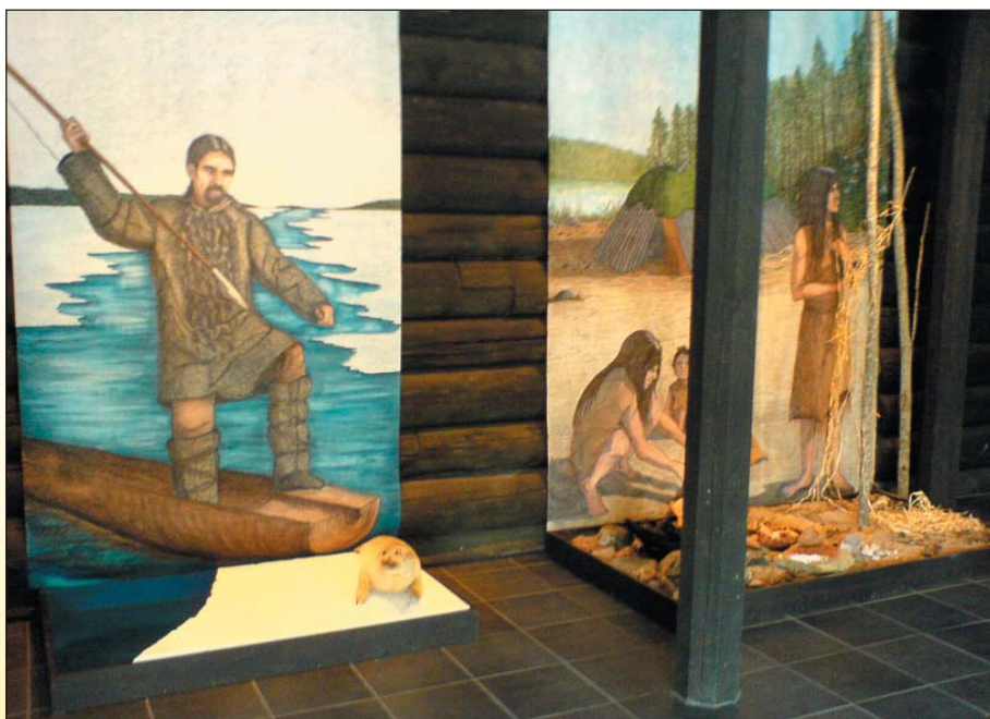
Utställning på Fattborg.