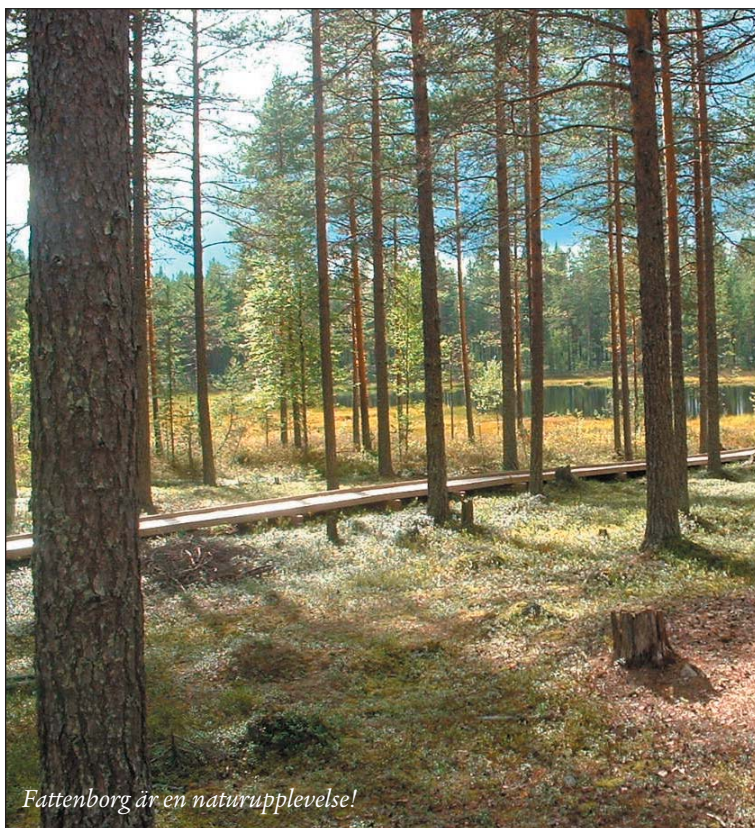
Fattborg är en naturupplevelse!

Välkommen till en informativ och avstressande miljö!