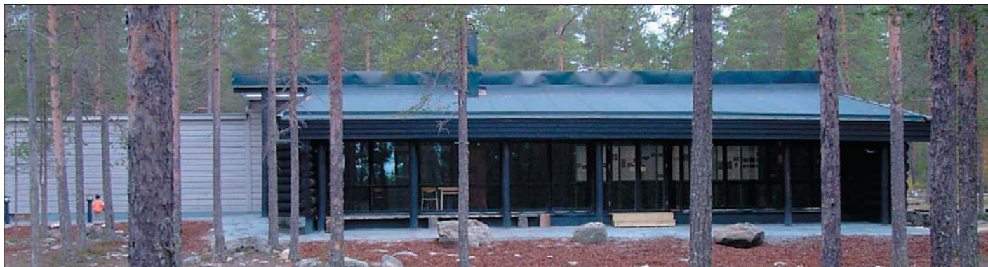
Informationsbyggnaden i rundtimmer.