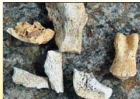
Benbitar, spår från forntiden.

Från Luleå/Kalix: Ta av vid Shell i Töre och åk E10 norrut. Sväng sedan vänster vid skylten: Fattborg 12 km. Följ sedan vägen. Från Överkalix: Åk E10 passera Morjärv ta sedan höger ungefär en mil norr om Töre. Sväng sedan höger vid Skylten: Fattborg 12 km. Följ sedan vägen mot Fattborg.